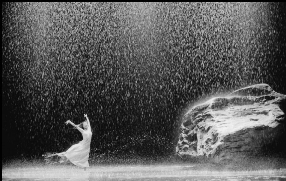
Vollmond by Pina Bausch (2006)